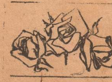
இன்றே எழுதி ராணி மரிசுத் திட்டப் பக்கங்கள் பெறுங்கள்

ராணி சந்தன சோய் சுத்தி இலகூட்டியல் வேர்க்கல் விசிட்டெல் தபாற் பெட்டி 31, கொழும்பு