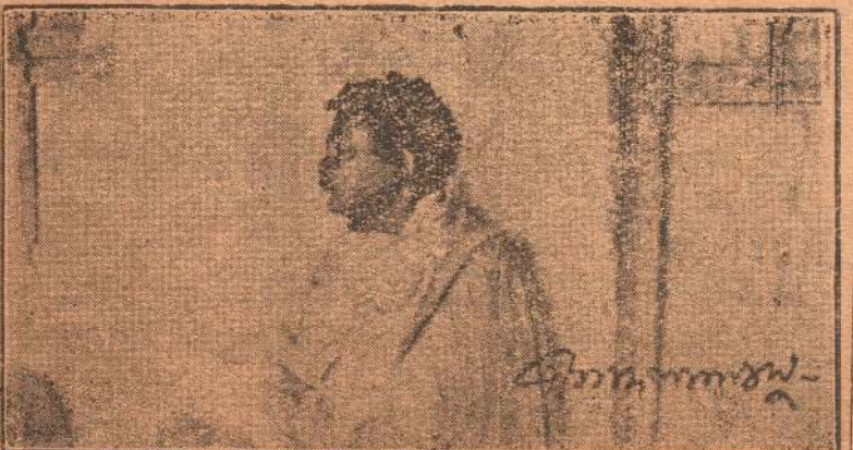
புதி நந்தலால் போல்