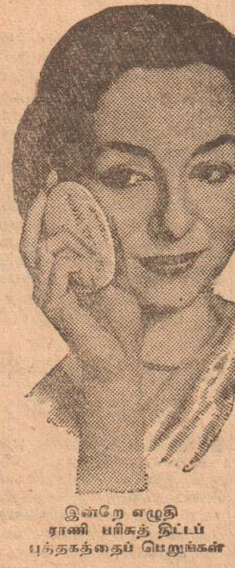
இன்றே எழுதி ராணி பரிசுத் திட்டப் புத்தகத்தைப் பெறுங்கள்