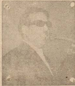
சென்னை, ஜூன் 6 தி. மு. க. ஆட்சியில் யாரும்

மலர்: 19 வலகாசி 25 ஜி ஆட்சி: 19 இதழ்: 11 யாழ்ப்பாணம் செவ்வாய்க்கிழமை 7-6-77