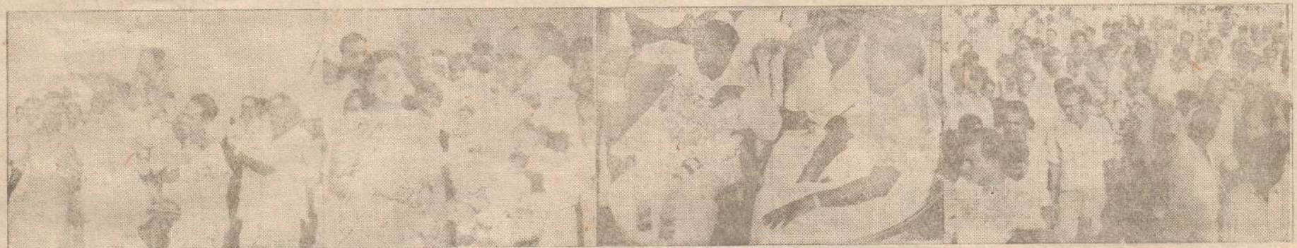
இங்கையின் ரெலாற்றில் ஆட்சிமன்றத்தின் எதிர்க்கட்சித் தலைவராக பதவியேற்ற முதல் தமிழ்மகனான திரு. அ. அமிர்தலிங்கம் ஆட்சிமன்ற நிகழ்ச்சிகளில் கலந்துகொண்டபின் யாழ்ப்பாணம் திரும்பியபோது மக்கள் அளித்த குதூகல வரவேற்பை மேலே உள்ள படங்களில் காண்கின்றீர்கள். விமானத்திலிருந்து 'அமிர்' ஆதரவாளர்களால் தோளில் தூக்கிவரப்படுவதை முதல் படத்திலும் கழுத்து நிறைத்த மாலைகளுடன் அவர் தமது பாரியாருடன் மகிழ்ச்சிபொங்கி நிற்பதை இரண்டாவது படத்திலும், விமான நிலைய வரவேற்பு அறையில் 'அமிர்'டன் வி. பி. யை மூன்றுவது படத்திலும், 'அமிர்' தம்பதிகள் ஊர்வலமாக அழைத்தச் செல்லப்படுவதை நாலாவது படத்திலும் காணலாம்.