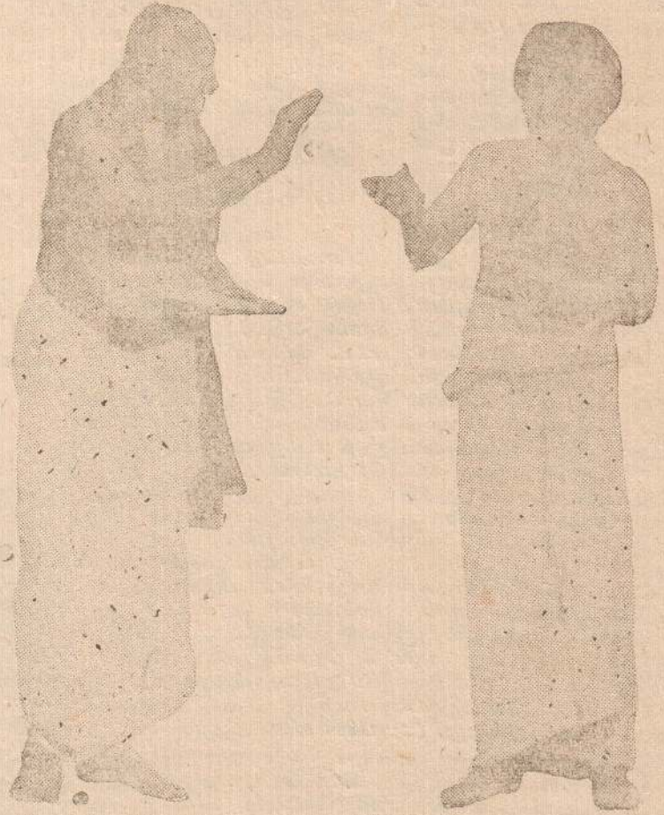
இசை: குன்னக்குடி வைத்தியனாதன் கதை-வசனம்-தயாரிப்பு: சாண்டோ M.M.A. சின்னப்பா தேவர்