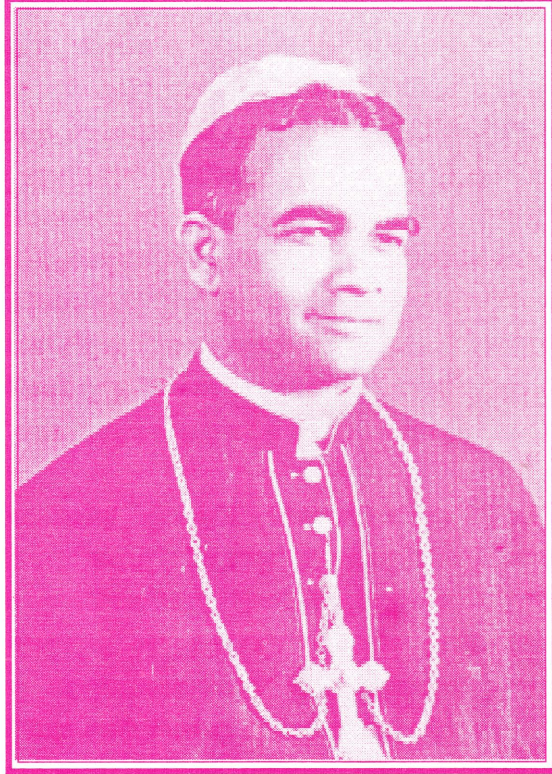
அமரர் மேதகு வ. தியோகுய்யிள்ளை ஆண்டகை (முன்னாள் யாழ். ஆயர் 1973 : 1992)