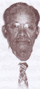
கவிஞர் சோ. பத்மநாதன்