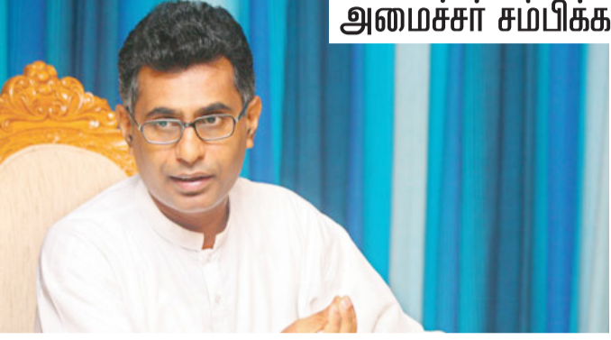
அமைச்சர் சம்பிக்க ரணவக்க தெரிவிக்கிறார்

துப்பாக்கிகளைக் காட்டி யாரையும் கட்டுப்படுத்தும் அரசியல் கலாசாரம் எமது நல்லாட்சியில் இல்லை. சுயாதீனமான சட்டநகர்வுகளின் மூலமே நல்லாட்சி அரசு சகல பிரச்சினைகளையும் கையாள்வதற்கான பெரிய நகர மற்றும் மேல் மாகாண அபிவிருத்தி அமைச்சர் சம்பிக்க ரணவக்க தெரிவித்தார்.