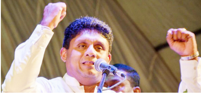
கூறுகிறார் அமைச்சர் சஜித் பிரேமதாஸ

அம்பாந்தோட்டையில் நடைபெற்ற நிகழ்வு ஒன்றில் கலந்துகொண்டு உரையாற்றுகையில் அவர் மேற்கண்டவாறு தெரிவித்துள்ளார். இது தொடர்பில் அவர் மேலும் தெரிவித்தவை வருமாறு:- தற்போது நல்லாட்சி அரசால் வீடமைப்பு திட்டத்திற்கு