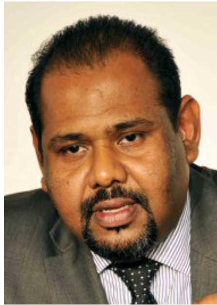
களுக்கும் அவர்கள் தெளிவுபடுத்தியிருந்தார்கள்.

சிங்களவர்கள் தமிழர்களைப் பார்த்து தமிழர்கள் 'சிறிலங்கர்கள்' என்று அடையாளப்படுத்துவதை அல்லது அவ்வாறு அழைப்பதை நாம் ஒருபோதுமே ஏற்றுக் கொள்ளப்