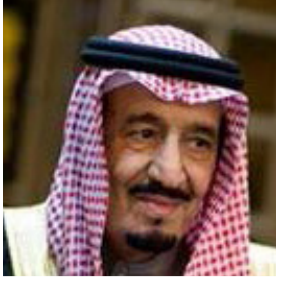
விடுமுறைச் செலவு 650 கோடி ரூபா!