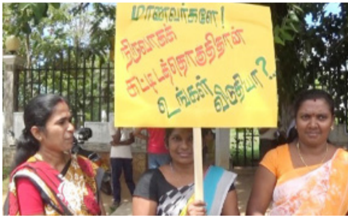
கத்தின் ஆசிரியர்கள், ஊழியர்கள் மற்றும் நிர்வாக உத்தியோகத்தர்களுக்கு பெரும் சிரமத்தைக் கொடுக்கிறது