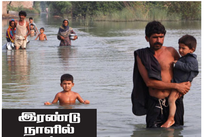
இரண்டு நாட்களில் 24 பேர் சாவு

இஸ்லாமாபாத், ஓக.24 பாகிஸ்தானில் பெய்த கனமழையால் கராச்சியில் கடந்த இரண்டு நாட்களில் மட்டும் 24 பேர் பலியாகியுள்ளனர். பாகிஸ்தானில் கடந்த திங்கட்கிழமை முதல் கனமழை பெய்து வருகின்றது. இதனால் தாழ்வான பகுதிகள் வெள்ளத்தில் மூழ்கியுள்ளன. மேலும் வீடுகளில் வெள்ள நீர் புகுந்ததால் மக்கள் இயல்பு வாழ்க்கை பாதிக்கப்பட்டுள்ளது. இந்த வெள்ளத்தால் பாகிஸ்தானில் உள்ள சித் மாகாணத்தின் தலைநகரான கராச்சி நகரில் மட்டும் 24 பேர் பலியாகினர். அவர்கள் மின்சாரம் தாக்கியும், வெள்ளத்தில் மூழ்கியும் மற்றும் வீட்டின் இடிபாடுகளில் சிக்கியும் இறந்தனர் என அதிகாரிகள் தெரிவித்துள்ளனர். மழையால் பல இடங்களில் மின்சாரம் துண்டிக்கப்பட்டது.