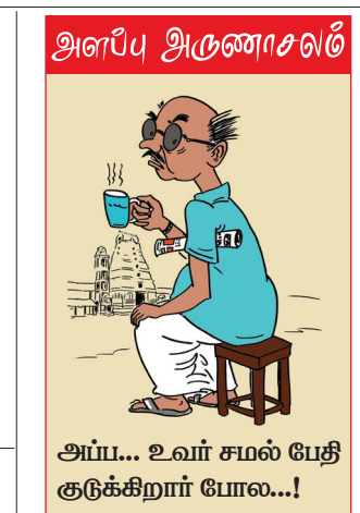
அப்ப... உவர் சமல் பேதி குடுக்கிறார் போல...!