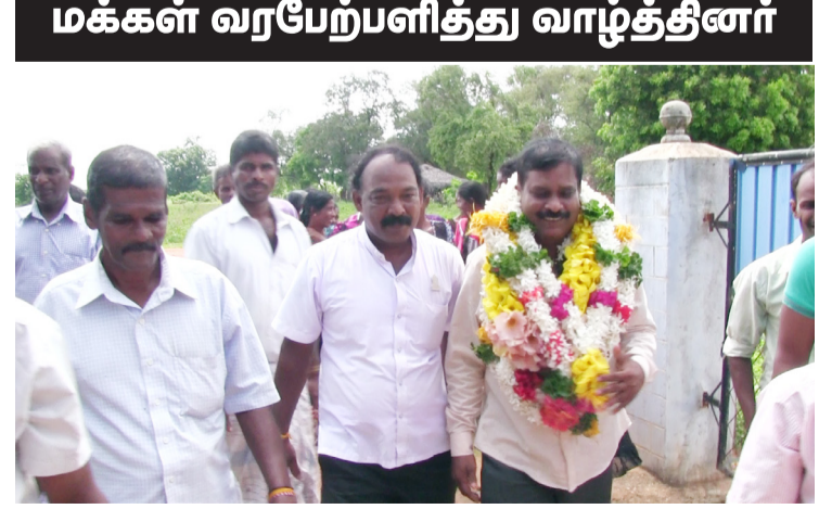
மக்கள் எதிர்நோக்கும் பல்வேறு பிரச்சினைகள் அமைச்சரின் கவனத்திற்குக் கொண்டுவரப்பட்டன. அத்துடன், அமைச்சராகப்