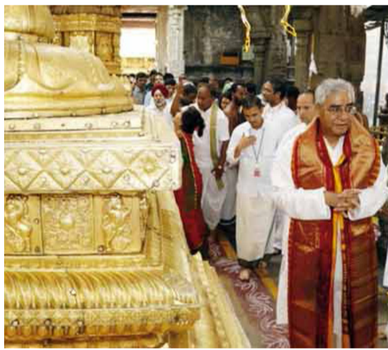
ஆந்திர மாநிலம் திருப்பதி ஏழுமலையான் கோயிலுக்கு சென்ற நேபாள பிரதமர் தியூபா தனது குடும்பத்தினருடன் சுவாமி தரிசனம் செய்தார்.

மன்மோகன் சிங் பிரதமராக இருந்த காலத்தில், ஆண்டுக்கு 5 வயதுக்குட்பட்ட பத்து லட்சம் குழந்தைகள் இந்தியாவில் ஊட்டச்சத்துக் குறைபாட்டினால் இறக்கின்றனர் என்றும். இந்தியாவில் 48.1 சதவிகித பெண்கள் ரத்தச் சோகையுடன் இருக்கிறார்கள் என்றும் வெளிப்படையாக தெரிவித்தார் என்பது குறிப்பிடத்தக்கது. (ப)