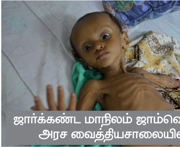
ஜார்க்கண்ட் மாநிலம் ஜாம்ஷெட்பூர் அரசு வைத்தியசாலையில்

குழந்தைகளில் உயிரிழப்புக்கு ஊட்டச்சத்துக் குறை