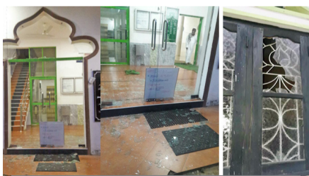
சந்தேகத்தில் ஐவர் உடனடியாகக் கைது

நடத்தியவர்கள் தாக்குதல் நடத்த முன்னர் சந்தேகத்திற்கிடமான முறையில் உலவியமை நாரம்மல பகுதி ஹோட்டல் ஒன்றின் கண்காணிப்புக் கமராவில் பதிவாகியிருந்த நிலையில் அதனை ஆதாரமாகக் கொண்டு இந்த நபர்கள் நேற்றுக் காலை கைது செய்யப்பட்டுள்ளனர். (உ)