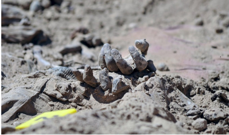
தற்போது அமெரிக்க இராணுவத்தின் உதவியுடன் ஈராக்கில் மீட்டுகிறது. அதைத் தொடர்ந்து அங்கு ராணுவம் மொசூல் உள் ளிட்ட பெரும்பாலான பகுதிகளை மீட்டுகிறது. அதைத் தொடர்ந்து அங்கு ராணுவம்

பக்தாத். ஓக.28 ஈராக்கில் 2 புதை குழிகளில் 500 இற்கும் மேற்பட்ட டோரின் உடல்கள் தலை துண்டிக்கப்பட்ட நிலையில் கண்டுபிடிக்கப்பட்டுள்ளன. ஈராக்கில் கடந்த 2014ஆம் ஆண்டில் ஐ.எஸ். தீவிரவாதிகளின் ஆதிக்கம் தொடங்கியது. அப்போது ஈராக்கின் 2ஆவது பெரிய நகரமான மொசூல் மற்றும் அதைச் சுற்றியுள்ள பகுதிகளை கைப்பற்றி இஸ்லாமிய தேசம் என்ற தனி நாடு உருவாக்கினார்கள்.