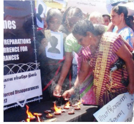
எதுடன், இலங்கை மனித உரிமைகள் ஆணைக்குழுவின் மட்டக்களப்பு மாவட்ட இணைப்பாளர் அசீஸிடமும் வழங்கப்பட்டுள்ளது.

இதன்போது ஏழு கோரிக்கைகள் அடங்கிய மகஜர் இலங்கை மனித உரிமைகள் ஆணைக்குழு ஐக்கிய நாடுகள் சபையின் மனித உரிமைகள் ஆணைக்குழு ஆகியவற்றுக்கு வழங்கப்பட்டுள்ள