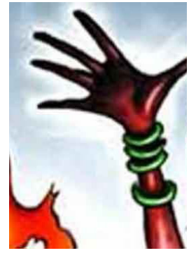
லக்னோ. ஓக. 31

திருமணத்திற்கு மறுத்தார் காதலன்; தீக்குளித்தார் 15 வயது சிறுமி!