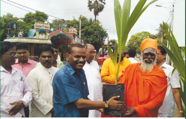
சுப்பிரமணிய பாரதியாரின் 95ஆவது நினைவுநாள் நேற்று யாழ்ப்பாணத்தில் நடைபெற்ற போது எடுக்கப்பட்ட படங்கள். (மற்றொரு செய்தி 5ஆம் பக்கத்தில்)