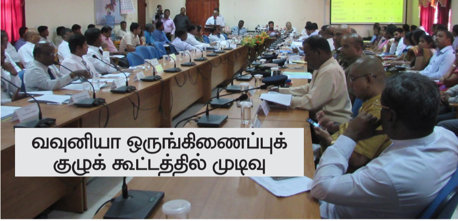
வவுனியா ஒருங்கிணைப்புக் குழுக் கூட்டத்தில் முடிவு