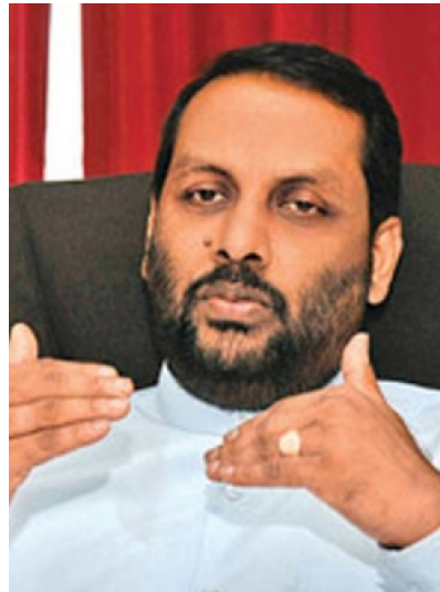
களை அழித்து நாட்டை மீட்டெ டுக்க இந்த போராட்டம் நடை பெற்றது. மாறாக தமிழ் மக்களை

ஆயுதம் தரித்த புலிகளும் இலங்கையின் மக்களே. அவர்