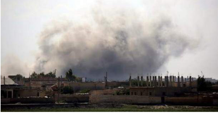
வர்கள் வைத்தியசாலையில் சேர்க்கப்பட்டுள்ளனர்.