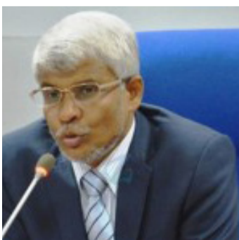
இளைதவறான கருத்து மூலம்,

கிழக்கு மாகாண இன உறவு தொடர்பில் அவர் வெளியிட