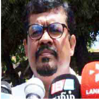
நியமனத்திற்காகப் போராட்டத்தில் ஈடுபட்டிருந்தனர்.