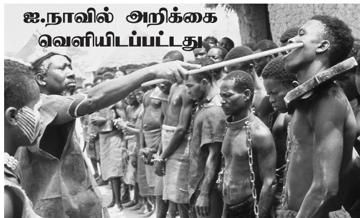
ஐ.நாவில் அறிக்கை வெளியிடப்பட்டது

உலகளவில் 4 கோடி பேர் நவீன அடிமைத்தனத்தில் சிக்கித் தவிக்கின்றனர். 15 கோடிக்கும் மேற்பட்ட குழந்தைத் தொழிலாளர்கள் இதிலே அடங்கியுள்ளனர். சர்வதேசத் தொழிலாளர் அமைப்பு மற்றும் சர்வதேச புலம்பெயர்வு அமைப்பு ஆகியவை இணைந்து, உலகளவில் அடிமைத்தனத்தில் சிக்கி உள்ளவர்கள் மற்றும் குழந்தைத் தொழிலாளர்களின் நிலை குறித்து நடத்திய ஆய்வு அறிக்கை ஐ.நா. பொதுச் சபைக் கூட்டத்தில் கடந்த செவ்வாய்க்கிழமை வெளியிடப்பட்டது. அதிலே, உலகளவில் அடிமைத்தனத்தில் சிக்கிய 4 கோடி பேரில் 2.90 கோடி பேர் பெண்கள் மற்றும் சிறுமிகள் ஆவர். இன்னும் 15.2 கோடி அளவுக்கு குழந்தைத் தொழிலாளர்கள் உள்ளனர். இவர்களில் 7.21 கோடி பேர் ஆபிரிக்காவிலும் அதற்கடுத்த நிலைகளில் ஆசியா, பசிபிக்கிலும் வசிக்கின்றனர். நவீன கால அடிமைத்தனத்திலே சிக்கிய 4 கோடி பேரில் ஒருவர் குழந்தை தொழிலாளராகவும் இருக்கிறார் என்று அறிக்கையில் கூறப்பட்டுள்ளது.