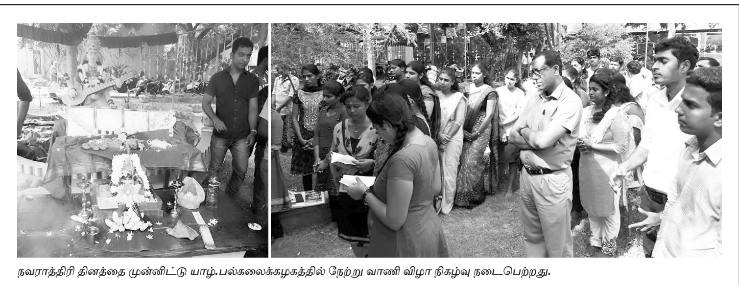
நவராத்திரி தினத்தை முன்னிட்டு யாழ்.பல்கலைக்கழகத்தில் நேற்று வாணி விழா நிகழ்வு நடைபெற்றது.

பத்தில் நடைபெற்றது. முல்லைத்தீவு வித்தியானந்த தேசிய பாடசாலை அணி வீரர்கள் இந்தப் போட்டியில் நான்கு தங்கப்பதக்கங்களைப் பெற்று இந்த வெற்றியைப் பெற்றனர். 13-14 15-16 17-18 என்ற வயது பிரிவுகளில் நடைபெற்ற போட்டிகளில் 44 அணிகளில் சுமார் 200 வீரர்கள் கலந்துகொண்டனர். (உ)