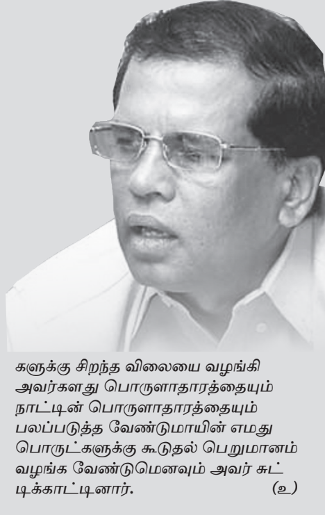
களுக்கு சிறந்த விலையை வழங்கி அவர்களது பொருளாதாரத்தையும் நாட்டின் பொருளாதாரத்தையும் பலப்படுத்த வேண்டுமாயின் எமது பொருட்களுக்கு கூடுதல் பெறுமானம் வழங்க வேண்டுமெனவும் அவர் சுட்டிக்காட்டினார். (உ)

அத்தியாவசியமற்ற உடல் ஆரோக்கியத்துக்கு ஊறு விளைவிக்கும் அனைத்து உணவுப் பொருட்களினதும் இறக்குமதியை நிறுத்துவதற்கு தேசிய பொருளாதார பேரவை ஊடாக நடவடிக்கை எடுக்க எதிர்பார்ப்பதாக ஜனாதிபதி மைத்திரிபால சிறிசேன தெரிவித்துள்ளார். களுத்துறை போம்புவல சேவைக் கால பயிற்சி நிறுவனத்தின் விவசாய கண்காட்சியை நேற்றுப் பிற்பகல் ஆரம்பித்து வைக்கும்போதே ஜனாதிபதி இவ்வாறு குறிப்பிட்டார். நிகழ்வில் ஜனாதிபதி தொடர்ந்தும் உரையாற்றுகையில், அத்தியாவசியமான உணவுப் பொருட்கள் இறக்குமதிக்கு மட்டும் 2500 கோடிக்கு கூடுதலான பணம்செலவிடப்படுவதாகவும் ஆயிரக் கணக்கான ஆண்டு நாட்டின் பண்பாட்டையும் தனித்துவத்தையும் பாதுகாத்து எமக்குத் தேவையான உணவுப் பொருட்களை எமது நாட்டிலேயே உற்பத்தி செய்ய வேண்டியது கட்டாயமானதென்றும் ஜனாதிபதி தெரிவித்தார். உள்நாட்டு விவசாயிகளின் உற்பத்தி