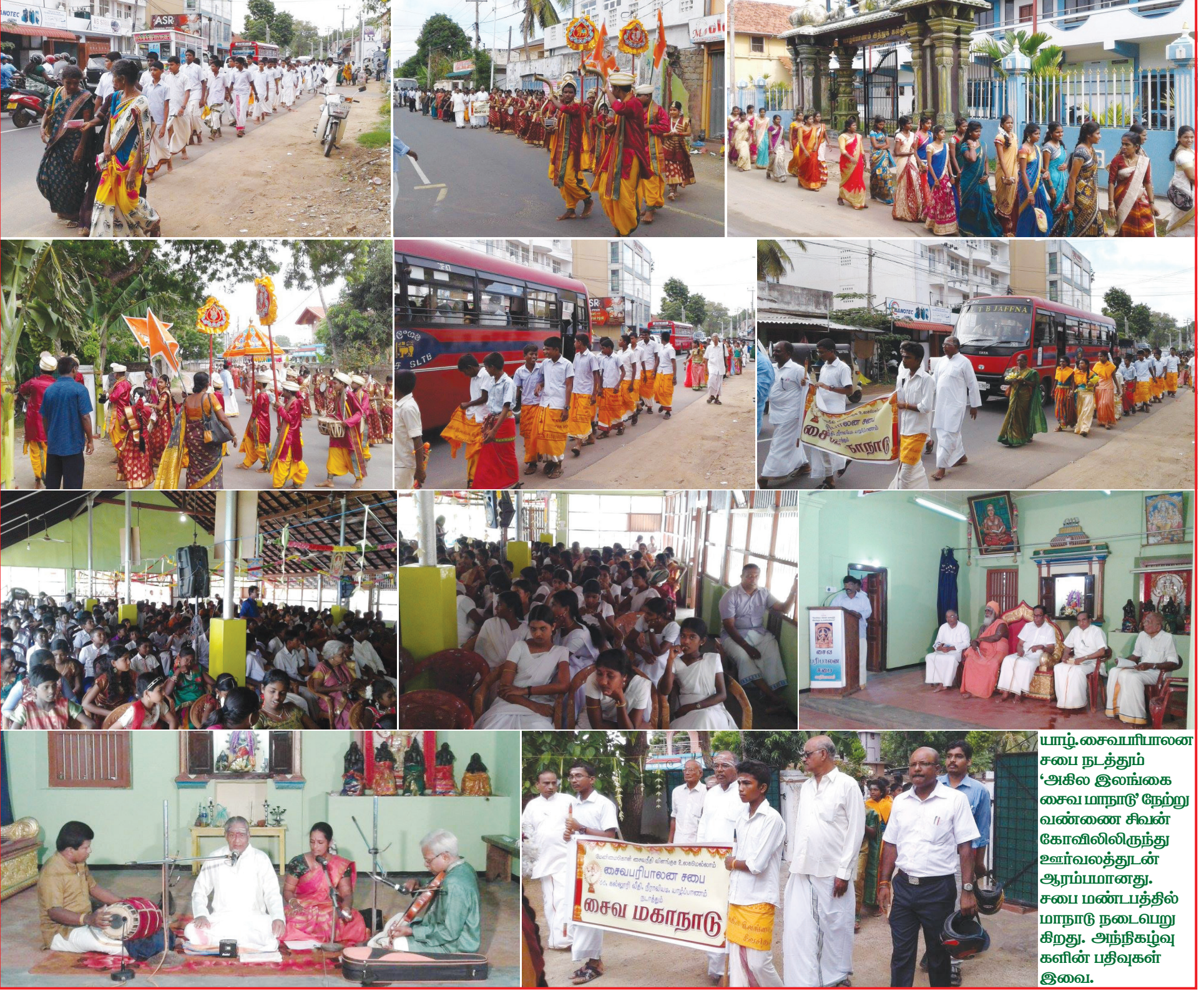
யாழ்.சைவபரிபாலன சபை நடத்தும் 'அகில இலங்கை சைவ மாநாடு' நேற்று வண்ணை சிவன் கோவிலிலிருந்து ஊர்வலத்துடன் ஆரம்பமானது. சபை மண்டபத்தில் மாநாடு நடைபெறுகிறது. அந்நிகழ்வுகளின் பதிவுகள் இவை.