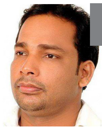
வியாழேந்திரன் எம்.பி. அதிருப்தி

வழங்கப்படுகின்ற பன்முகப்படுத்தப்பட்ட நிதியை மட்டக்களப்பு மாவட்டத்தில்