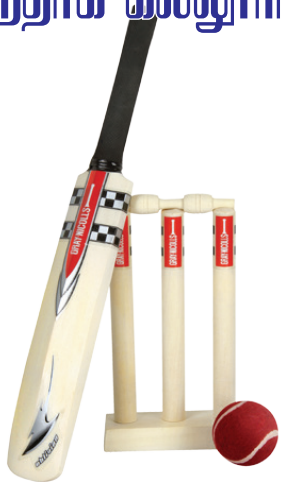
மிழக்காமல் 21 ஓட்டங்களைப் பெற்றனர். பந்து வீச்சில் சந்தோஷ் 20 ஓவர்களுக்கு 2 விக்கெட்டுக்களை வீழ்த்தினார்.

பந்து வீச்சில் ஹசீடு 3 ஓட்டங்களுக்கு 4 விக்கெட்டுக்களையும், ஷமால் 8 ஓட்டங்களுக்கு 3 விக்கெட்டுக்களையும் வீழ்த்தினார். பதிலுக்குத் துடுப்பெடுத்தாடிய ஆனந்தாக் கல்லூரி அணி 27.1 ஓவர்களில் 5 விக்கெட் இழப்புக்கு 131 ஓட்டங்களைப் பெற்று ஆட்டத்தில் வெற்றியீட்டியது. கனிஷ் 17, கவிந்து 27, லாஹிரு ஆட்டமிழக்காமல் 34, ருஷான் ஆட்ட