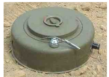
பான் முன்வந்துள்ளதாகத் தெரிவிக்கப்படுகின்றது.

இந்த நிலையில், வடக்கிலுள்ள நிலக்கண்ணி வெடிகளை அகற்றுவதற்கு ஜப்