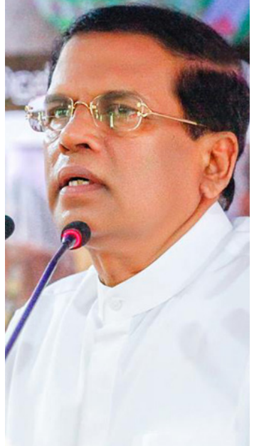
கின்றது என்றும் ஜனாதிபதி மைத்திரிபால சிறிசேன தொடர்ந்தும் வாழ்த்தியுள்ளார்.