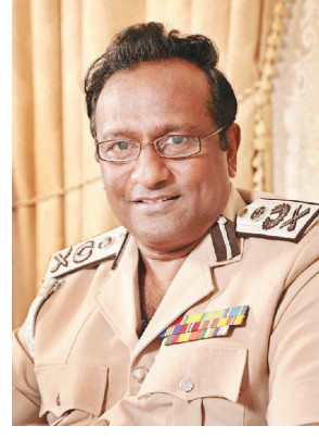
இழந்து - ஊனமுற்று - காப்பாற்றிய இந்த நாட்டை மீண்டும் பயங்கரவாதிகளிடம் கூட்டாட்சி முறைமையின் கீழ் பிரித்துக் கொடுப்பதற்கு இந்த அரசு முற்படுகிறது. இவ்வாறு படையினரைக் கவனிக்கும் ஓர் அரசு இந்த உலகில் எங்குமில்லை - என்றும் அவர் கூறினார். (உ)

தள்ளியுள்ளது இந்த அரசு. காணாமல் போனோர் அலுவலகத்தை நிறுவி உயிரிழந்த படையினரையும் பலிகளையும் சமமாக மதித்து அவர்களுக்கு இழப்பீடு வழங்குவதற்கு ஏற்பாடு செய்துள்ளது. அந்த அலுவலகத்தின் ஊடாகப் பொய்ச் சாட்சிகளைத் திரட்டிப் படையினரைப் பன்னாட்டுப் போர்க் குற்ற நீதிமன்றத்துக்கு அனுப்புவதற்கும் திட்டமிடுகின்றது. ஓய்வூதியம் கேட்டுப் போராட்டம் நடத்தும் ஊனமுற்ற படையினர் மீது தாக்குதல் நடத்தி அவர்களை மேலும் காயப்படுத்துகின்றது. எமது படையினர் உயிரை