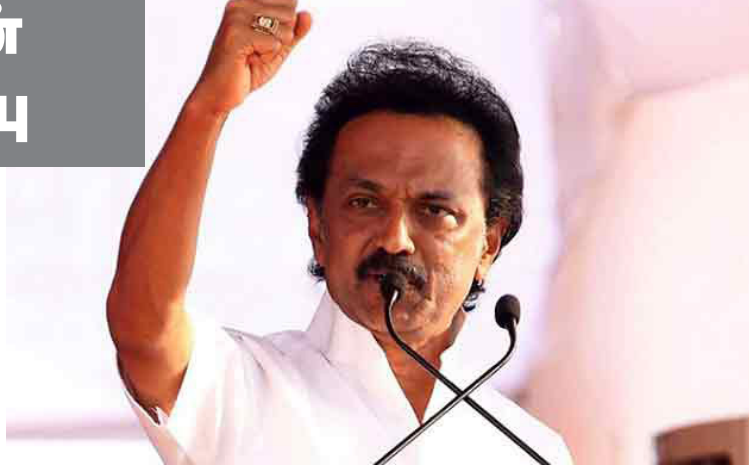
களை திரட்டி போராட்டம் நடத்த வேண்டும். நீட் விவகாரத்தில் தமிழக மாணவர்களை நம்பவைத்து கழுத்

சரியாக அமைந்துள்ளது. தமிழகத்தை மத்திய அரசிடம் அடைவுவைத்துவிட்டது அ.தி.மு.க. அரசு. பெரும்பான்மை இல்லாத அரசு செயற்பட ஆளுநர் எப்படி அனுமதி அளிக்கிறார்? என்று தெரியவில்லை. மேலும், நீதிமன்றம் மூலம் நல்ல செய்தி வரும். ஒரு வேளை வராவிட்டால் மக்