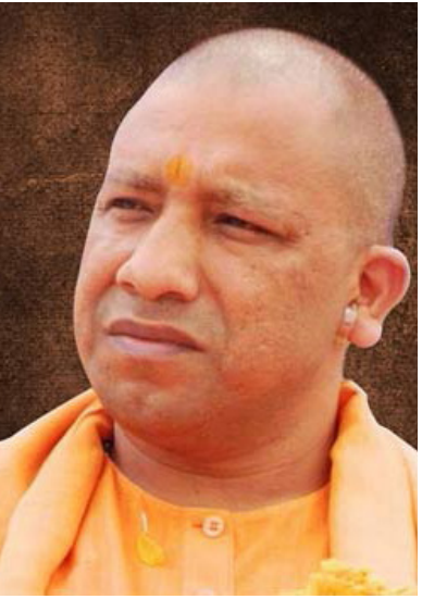
பதவி ஏற்ற பின்பு 1,106 தேடப்படும் குற்றவாளிகளைக் கைது செய்யப்பட்டுள்ளனர். இவர்களில் 868 பேர் பொலிஸாரால் பரிசு அறிவிக்கப்பட்ட குற்றவாளிகள் என்பது குறிப்பிடத்தக்கது.

களில் பெண்களை கிண்டல் செய்பவர்கள், இடையூறு செய்பவர்கள் மீது பொலிஸார்களும் நடவடிக்கை எடுத்தனர். தொடர்ந்து ரவுடிகள், குற்றவாளிகளை ஒழிக்கும் பணியில் ஈடுபட பொலிஸிற்கு முதலமைச்சர் யோகி ஆதித்யநாத் உத்தரவிட்டார். தேவைப்பட்டால் “என்கவுண்டர்” நடத்தவும் அதிகாரம் வழங்கினார். இதனையடுத்து யோகி ஆதித்யநாத் பதவி ஏற்ற மறுநாள் தொடங்கி செப்டெம்பர் 14ஆம் திகதி வரை 15 என்கவுண்டர்கள் நடைபெற்று இருக்கின்றன என தகவல் வெளியாகி உள்ளது. இதில் 15 ரவுடிகள், குற்றவாளிகள் சுட்டுக்கொல்லப்பட்டனர். பொலிஸ் நடத்திய இந்த 15 என்கவுண்டரில் 84 பொது மக்களும், 88 பொலிஸாரும் காயம் அடைந்தனர். யோகி ஆதித்யநாத்