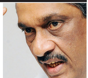
வார்த்தைகளில் நானும் பதிலடி கொடுத்துள்ளேன்.