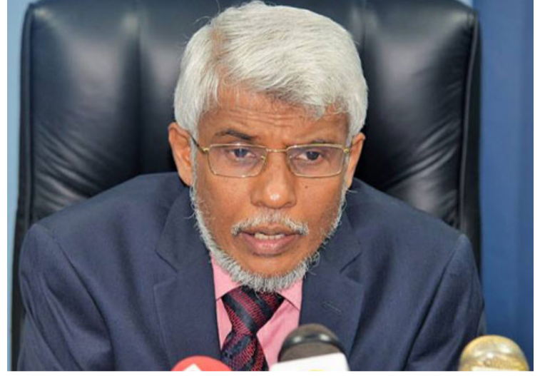
களுக்கு உண்மையைச் சொல்ல வேண்டும். அதுதான் ஒரு

குறைமதிக்கிறுக்கர்களான இத்தகைய அரசியல்வாதிகள், சிறுபான்மையினருக்கான அரசியல் விடிவு என்ன? அதனை அடைந்து கொள்வதற்கான விடிகளை எப்படி வகுக்க வேண்டும்? சமூக மக்களை ஒற்றுமைப்படுத்தி எப்படி வழிநடத்த வேண்டும்? என்ற அடிப்படை அறிவே இல்லாமல் கொக்கரிக்கின்றனர். அதனால், நாமும் சிறுபான்மையினம் என்ற வகையில் வெட்கப்பட வேண்டி உள்ளது. நல்லதோ, கெட்டதோ மக்