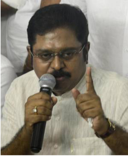
வேண்டிய அவசியமும் எங்களுக்கு

திருச்சி, செப். 20 இரட்டை இலை சின்னத்தை முடக்குமாறு ஜெயலலிதா கூறினாரா என ஓ.பன்னீர் செல்வத்துக்கு டி.டி.வி. தினகரன் கேள்வியெழுப்பியுள்ளார். திருச்சி உழவர் சந்தை மைதானத்தில் நேற்று அ.தி.மு.க. (அம்மா) அணி சார்பில் நீட் தேர்வில் இருந்து தமிழகத்திற்கு விலக்கு அளிக்கக் கோரி பொதுக்கூட்டம் நடைபெற்றவுள்ள நிலையில், ஸ்ரீரங்கம் ரங்கநாதர் சுவாமி கோவிலுக்கு சென்று சாமி தரிசனம் செய்த பின் அவர் நிருபர்களிடம் கூறியதாவது:- மத்திய அரசை கண்டு பயப்படுபவர்கள் நாங்கள் அல்ல. பயப்பட