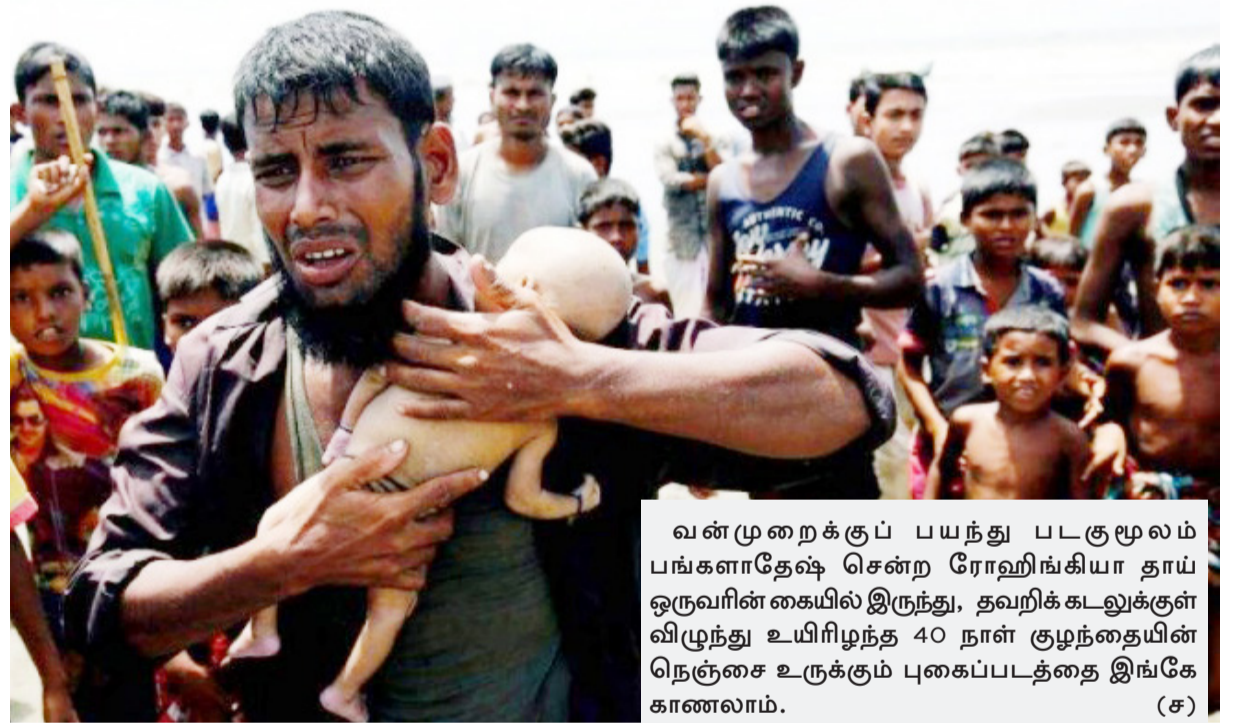
வன்முறைக்குப் பயந்து படகுமூலம் பங்களாதேஷ் சென்ற ரோஹிங்கியா தாய் ஒருவரின் கையில் இருந்து, தவறிக்கடலுக்குள் விழுந்து உயிரிழந்த 40 நாள் குழந்தையின் நெஞ்சை உருக்கும் புகைப்படத்தை இங்கே காணலாம்.