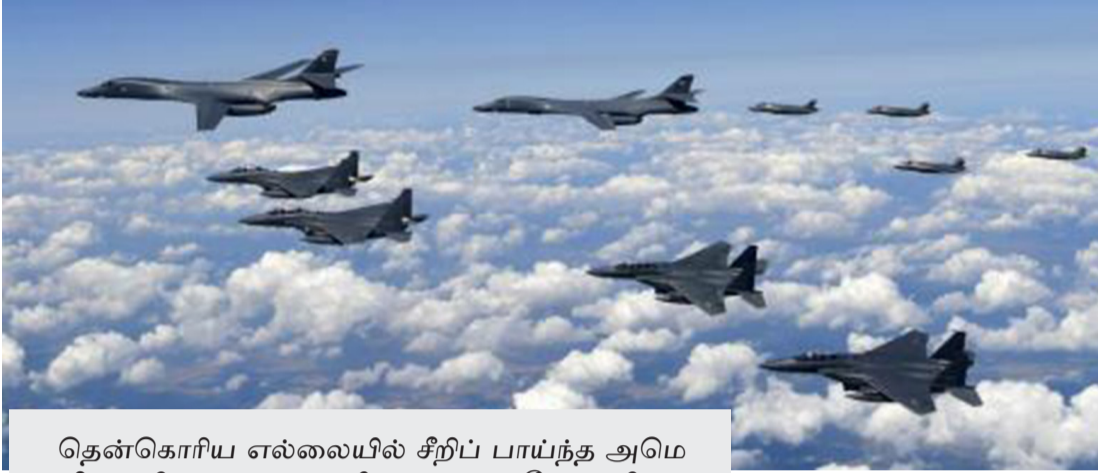
தென்கொரிய எல்லையில் சீறிப் பாய்ந்த அமெரிக்க விமானப்படையின் எப்-35 போர் விமானங்களையும், தென்கொரியாவின் எப்-15 கே போர் விமானங்களையும் படத்தில் காணலாம்.

“வடகொரியா மீது இராணுவ நடவடிக்கை எடுப்போம்” - என்று அமெரிக்கா எச்சரித்து வருகிறது. இதற்குப் பதிலடியாக அமெரிக்காவைச் சாம்பலாக்குவோம், அமெரிக்கா