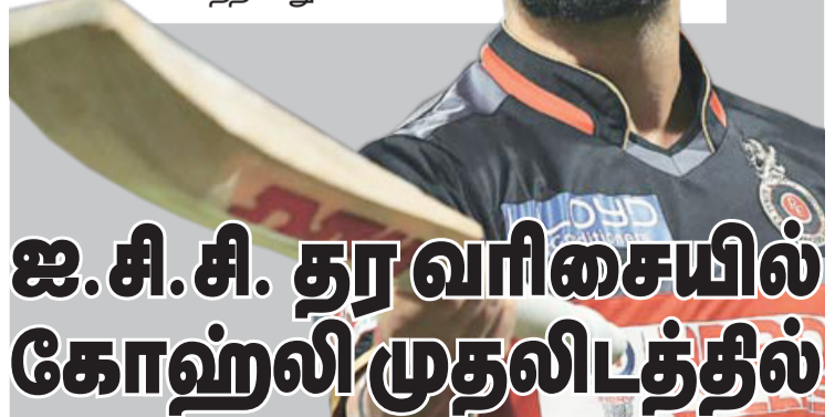
ஐ.சி.சி. தரவரிசையில் கோஹ்லி முதலிடத்தில்

சிறந்த ரி-20 அணிகள் பட்டியலில் நியூசிலாந்து முதலிடத்தில் உள்ளது. பட்டியலில் பாகிஸ்தான் இரண்டாமிடத்தில் இருக்க, இந்தியாவுக்கு ஐந்தாவது இடம் கிடைத்துள்ளது. இலங்கை அணி எட்டாவது இடத்தில் உள்ளமை குறிப்பிடத்தக்கது.