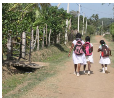
களாக பல்வேறு பிரதேசங்களில்

லும் வறட்சி நிவாரணங்கள் வழங்கப்பட்டு வருகின்றபோதும், எமக்கான வறட்சி நிவாரணங்கள் எவையும் வழங்கப்படவில்லை.