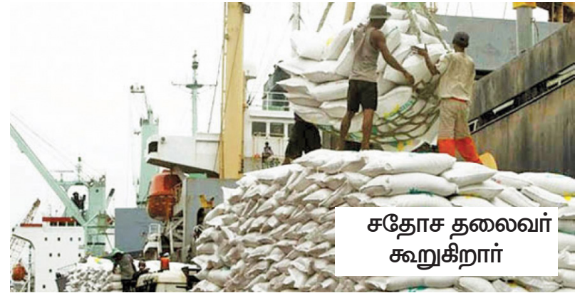
சதோச தலைவர் கூறுகிறார்

எவ்வாறாயினும், லங்கா சதோச விற்பனை நிலையங்களில் அரிசியின் விலை, தனியார் நிறுவனங்களின் விலை மட்டத்தையும் விடக் குறைந்த அளவில் காணப்படுவதாக சதோச விற்பனை நிலையங்களில் 75 ரூபாவுக்கும் 85 ரூபாவுக்கும் இடைப்பட்ட விலை மட்டங்களில் அரிசி