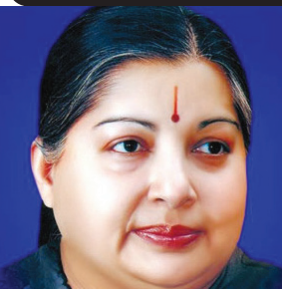
சென்னை, செப்.26 தமிழகமுன்னாள் முதல்

வர் ஜெயலலிதாவின் மரணம் குறித்து விசாரிப்பதற்கு ஓய்வு பக்கம் 18 >>>