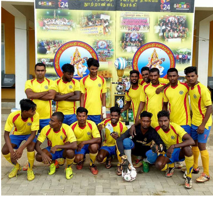
ஏ,பி என இரண்டு பிரிவுகளாகப் பிரிக்கப்பட்டு, போட்டிகள் நொக்கவுட் முறையில் நடைபெற்று வருகின்றன.

இந்தச் சுற்றுப்போட்டியில் யாழ். மாவட்டத்தைச் சேர்ந்த 32 உதைபந்தாட்ட அணிகள் பங்குபற்றுகின்றன. அணிகள்