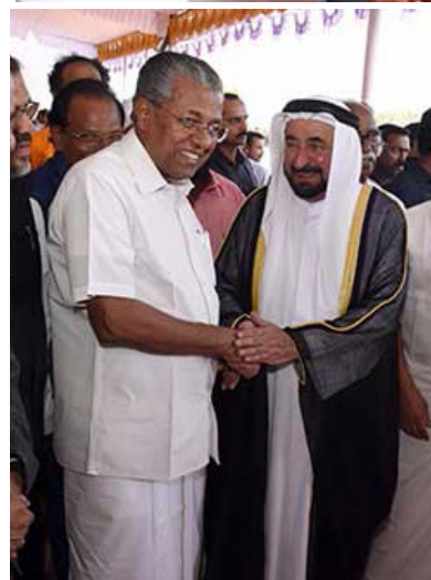
களை பற்றி தெரிவித்த உயர்வான கருத்துகளும் இன்றளவும் பசுமை

யாக நினைவில் உள்ளன. அவரது வருகையால் ஷார்ஜாவுக்கும் கேரளாவுக்கும் இடையிலான நல்லுறவுகள் மேம்பாடு அடையும் எனக் குறிப்பிட்டுள்ளார்.