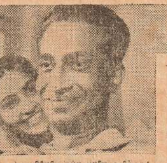
ஹாராலிக்ஸ் உண்மையில் நல்ல பலனை அளித்தது! பரிசுத்தமான பரமம், நேரமை மரவு, மசுட்டெட் பார்வி இவற்றின் சத்துக்கள் சேர்ந்த ஹாராலிக்ஸ் பருகி விசுவாமிலேயே அதிக சத்தியையும் சுறுசுறுப்பையும் பெற்றேன். சக்கிரத்திலேயே நான் விருமிய உத்தியோக உயர்வும் இடமாற்றமும் கிடைத்தன! ஹாராலிக்ஸுக்கு நன்றி நான் அடைந்த மலிந்திருக்க அளவே இல்லை.