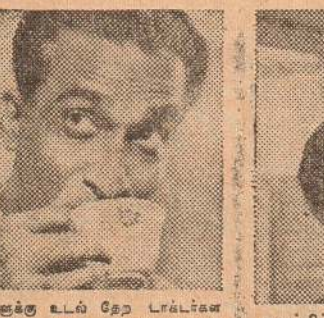
பஸ்களைக்கு உடல் நேர டாக்கா ஹாராலிக்ஸ் அருந்தும்படி சிபாரிசு செய்வது எனறிந்தேன். ஆனால், ஹாராலிக்ஸ் அருந்துவதற்குப் பஸ்கள் கிடைக்கும் என்ற நான் நினைத்ததில்லை. ஆனால் என் மனைவியிடமிருந்து ஹாராலிக்ஸ் அருந்துவதில் எவ்வளவு நல்ல பலன் கிடைப்பது!"