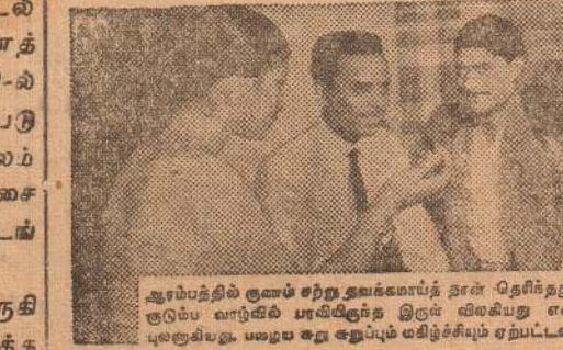
ஆரம்பத்தில் குணம் சீற்ற தவக்காய்ப் தான் தெரிந்தது. சிறகு எங்கக் குடுபல் வாழ்வில் புகழிடுக்த இருள் விடுகிறது என்ற பனிச்சேலைப் புலகுவிவது. பழைய கடி ஏற்படும் மதிச்சிம் ஏற்பட்டன.