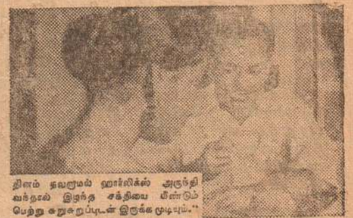
திரும்ப தலமும் ஹார்லிக்ஸ் அருள்புரி வந்தால் இதற்கு சக்தியை மீண்டும் பெற்று நிறைவுபட்ட இரக்க முடிபும்.