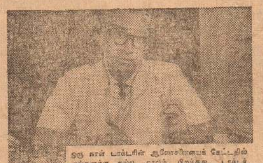
ஒரு நாள் டாட்டரின் ஆலோசனையைக் கேட்டதில் எங்களுக்கு கல்யாணம் ஏற்பட்டது. டாட்டர், ரெனால்ட்ஸ், 'சோர்வுப் பிணி, சிடுசிடுப்பு இவை பெரும்பாலும் பரவியதற்கு அறிவுரைகள்.