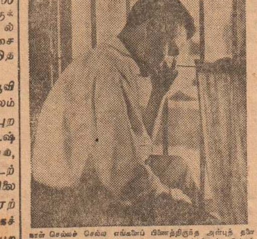
என் செல்வச் செல்வ எங்கெப் பிணைந்திருந்த அன்புத் தாய் தளர்ந்து இருவருமே நலிமையை காட்ட ஆரம்பித்தோம். இன்பம் நிலை வேண்டிய இவ்வற வாழ்வில் துன்பத்தின் சுவை படர்ந்தது.

இடையறாத சோர்வு காரணமாக மனம் எதிலும் நிலை கொள்ளாமல் தவித்தது. நாடுபொலாம் சீற்றம் ஏற்படுவதைக் கண்ட என் மனைவி என போதகைப் புரிந்து கொள்ள முடியாமல் வெறுப்புற்று ஒதுங்கினாள்.