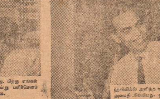
ஹார்லிக்ஸ் அளித்த நற்பலனிலும் எங்கள் குடும்பத்தில் அமைதி நிலைபெற்றது. ஹார்லிக்ஸ் அளிக்கும் புத்தவாச்சியை உணர்ந்துள்ள எங்கள் மனைவி பெரும்பாலும் பழைய மதிசை நிலைக்கு உணர்வை மாட்டோம்!