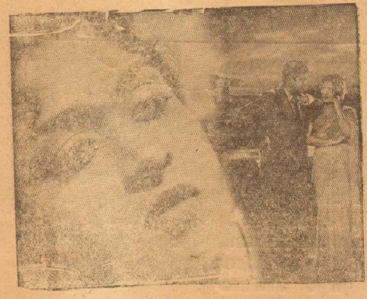
இவர்களின் (ஜெயினி-தேவிகா) உல்லாசம் அவரின் (சரே. ஜாதேவி) வேகனைக்கு காரணமாக இருக்குமோ ஆடிப்பெருக்கில் ஒரு காட்சி.