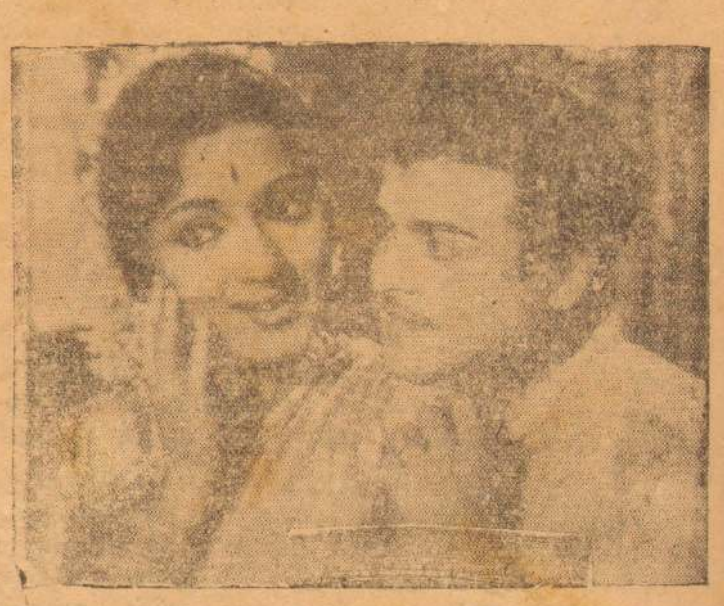
அத்தான் என்னத்தைச் சொல்ல என்கிறாரோ தேவிகா. ஆடிப்பெருக்கில் தேவிகா - ஜெயினி.

ஹாலிவுட்டின் மிகச் சிறந்த நடிகைகளில் ஒருவராக விளங்கியவரும் 57 வயது நிரம்பியவரும் இதுவரை நான்குமுறை விராகரத்துச் செய்துகொண்டவருமான ஜோன்சுராபோர்டு அமெரிக்கக்கோடல்வர்களில் ஒருவரான நெல்ஸன் ராக்பெல்லரை மணந்துகொண்டார்.