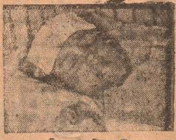
சுகவீனத்தினபோது புத்தணர்ச்சி பலக வல்லது

நாட்டின் உற்பத்தியை அதிகரிக்கச் செய்ய அரசாங்கம் தீவிர நடவடிக்கைகளை எடுத்து வருகின்றபோது, சில அரசாங்க பகுதி ஊழியர்களின் கவனக்குறைவினால் வெங்காய உற்பத்தியாளருக்கு பெரும் சிரமம் ஏற்பட்டதுடன் அரசாங்கத்தின் உருப்படியான திட்டத்தை செயல்படுத்தவும் முடியாத நிலை ஏற்பட்டுவிட்டது. யாழ்ப்பாணத்தொகுதி மக்கள் கூட்டரசாங்கத்தின் கோரிக்கையை ஏற்று அதிமமான அளவு வெங்காயம் உற்பத்திசெய்தார்கள். ஆனால் அவர்களுக்கு ஏற்பட்ட கஷ்டங்களுக்கு குறிப்பிட்டபகுதி ஊழியர்களின் கவனக்குறைவே முக்கிய காரணமாக இருக்கிறது. நான் சொழும்பு திரும்பியதும், திருப்பறி முழு நடவடிக்கை எடுத்து இங்கு உற்பத்தி செய்யப்பட்டுள்ள வெங்காயத்தை உடனடியாகக் கொள்வனவுசெய்வதற்கு ஒழுங்குகள் செய்வேன். இப்படியான கஷ்டம் வருவதைத் தவிர்த்து வெங்காய உற்பத்தியாளருக்கு ஏற்படாதவகையில் நடவடிக்கை எடுப்பேன். தமிழ் மக்களுக்கும் தாயக விளங்குவார் பிரதமர் திருமதி ஜீமாவோ, தமது குழந்தைகளுக்கு மட்டுமன்றி, இந்த நாட்டிலுள்ள சகல குழந்தைகளுக்கும், மக்களுக்கும் ஒரு தாய். தமிழ் மக்களின் ஒரு தாயாகவினக்கி தமிழ் மக்கள் எதிர்பார்த்துள்ள பிரச்சனைகளைத் தீர்ப்பதற்கு அவர் பெரும் அளவு