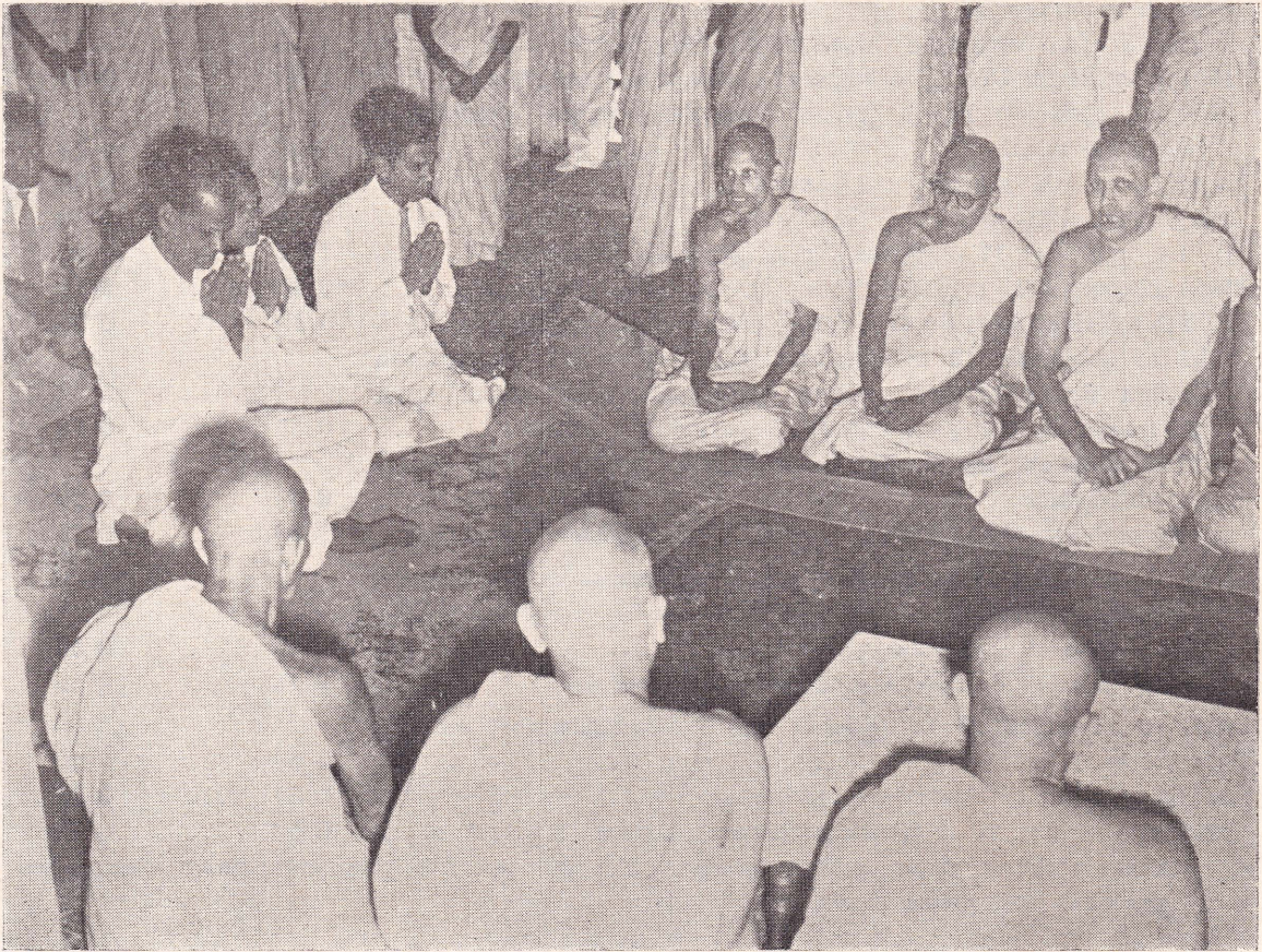
பிரதமர் மல்வத்தை பௌத்த மதப்பிரிவு நிலையத்தில் பிரித் ஒழும்போது கேட்டுக்கொண்டிருக்கிறார்.

“என தாவி யுள் கலந்த பெரு நல்லுதவிக் கைமாறு என தாவி தந்தொழிந் தேன் இனி மீள்வ தென்பதுண்டே? என தாவி யாவியும் நீ பொழிலேழுமுண்ட எந்தாய்! என தாவி யார்? யான் ஆர்? தந்த நீ கொண்டார்க்கினையே”