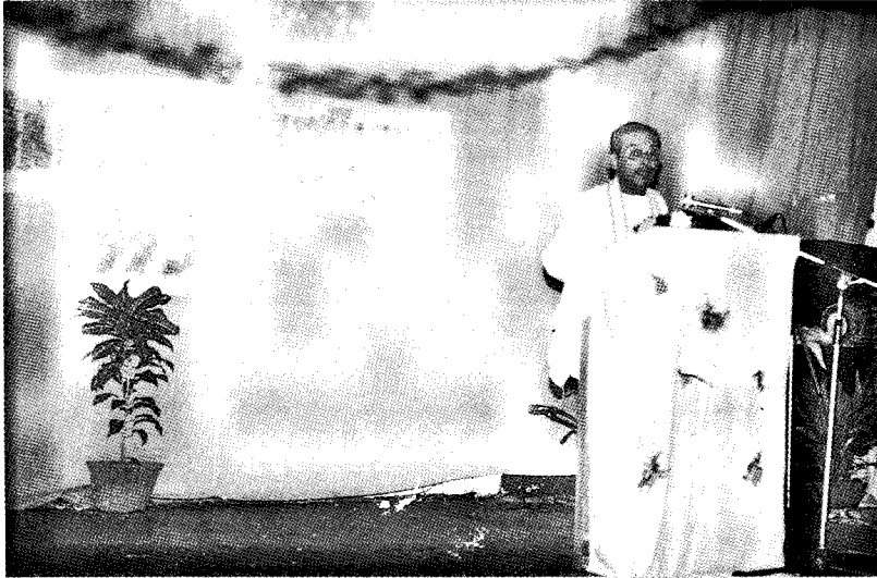
இராமநாதன் இந்து மகளிர் கல்லூரி விழா ஒன்றில் கலாநிதி