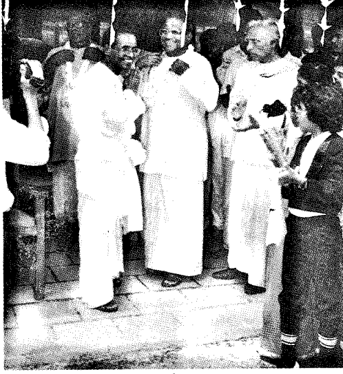
சுவாமிஜி விவேகானந்தரின் விஜய நூற்றாண்டு விழாவையொட்டி விவேகானந்த சபை முன்றலில் சுவாமிஜி விவேகானந்தரின் சிலை நிறுவப்பட்ட சமயம் அன்றைய மாநகர முதல்வரை வரவேற்கிறார்.