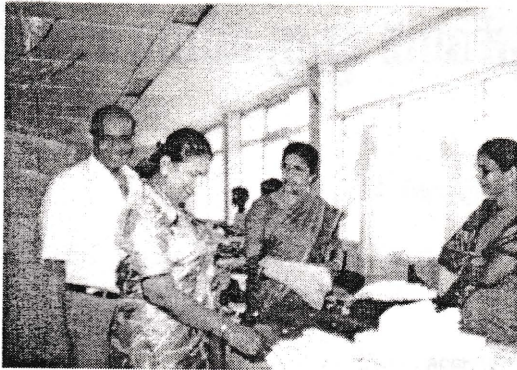
மலிவு விற்பனைக்கு பிரதம அதிகர்களாக வருகை தந்த திரு திருமதி தவயோகராஜா