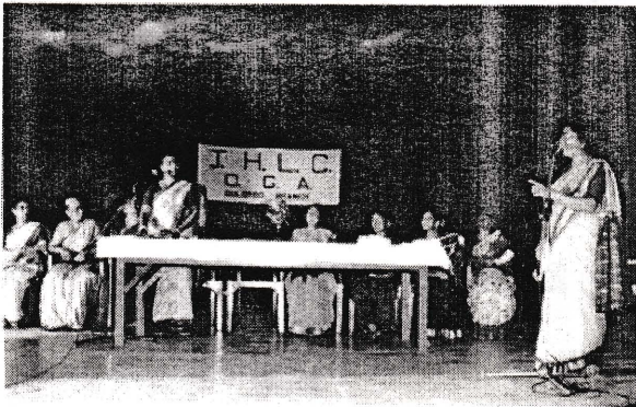
நம்மவர் நடத்தும் அரட்டையர் அரங்கம்