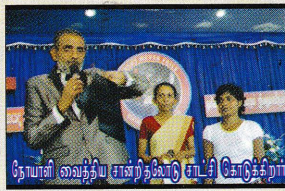
நோயாளி வைத்திய சான்றிதழோடு சாட்சி கோடுக்கிறார்

என்னுடைய சகோதரிக்கூடாக சனிக்கிழமை சுகமளிக்கும் ஆராதனையை அறிந்து 4 கிழமைகள் கலந்து கொண்டதன் பின்னர் வைத்தியரிடம் சென்ற போது புற்று நோய் இப்போது உடம்பில் இல்லையென உறுதிப்படுத்தினார். 4 வருடமாகவிரந்த மரணத்தருவாய்கேதுவான புற்று நோயினின்று சுகப்படுத்திய இயேசுகிறிஸ்துவுக்கு மகிமை உண்டாவதாக!