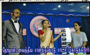
நோயாளி வைத்திய சான்றிதழோடு சாட்சி கோடுக்கிறார்

சென்றேன். அங்கேயும் பித்தப்பையை அகற்றப்பட வேண்டும் என்றார்கள். இதற்கிடையில் இயேசு கைவிடார் தெய்வீக விடுதலை ஆராதனைப் பற்றி அறிந்து அதில் ஒரு நாள் பங்கு பற்றினேன். அதன் பிறகு வெளிநாட்டிற்கு போக வேண்டியிருந்தது. அங்கே நான்கு மாதங்களுக்குப் பின்னர் மீண்டுமாக வயிற்றுலாவி ஏற்பட்டது. 3 நாட்களாக எவ்விதமான ஆகாரமும் உண்ண முடியவில்லை. அப்பொழுது என்னிடமிருந்த தெய்வீக அருள்பெற திரையில் கை வைப்போம் என்ற CDயை போட்டு பின் திரையில் கை வைத்த போது பரிபூரண விடுதலையை பெற்றதோடு ஆகாரமும் உட்கொண்டேன். வயிற்று வலியிலிருந்து பூரண சுகம் பெற்றேன். மீண்டுமாக இலங்கை வந்து ஆசிரி எனும் தனியார் வைத்தியசாலையில் வைத்திய பரிசீலனை செய்த போது பித்தப்பையில் கல் இல்லையெனக் கூறினார்கள். பித்தப்பையில் கற்களை அகற்றி என்னை குணப்படுத்திய இயேசுவுக்கு என்றென்றும் நன்றி கூறக் கடமைப்பட்டுள்ளேன்.