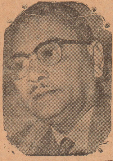
அய்யங்கான் வெனிநாடு விஜயம்

“இந்தோனேஷியாவை நகக்குவதில் நடுபட்ட ஏராளமான கொள்கைக்கள் இப்பொழுது காவலில் இருக்கின்றன. இவர்களில் சிலர் மலேசியாவில் இருந்து பின்னர் இந்தோனேஷியாவுக்குச் சென்று அங்கு பதிர்சிபெற்ற சீனர்கள்” என்றும் துங்கு கூறினார்.