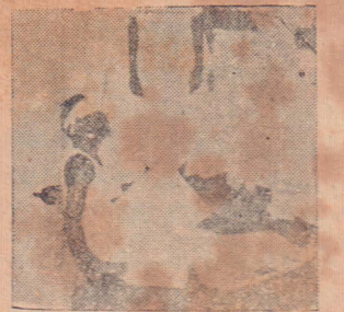
உயிருடன் போராடும் நோயாளி

“உரிமைக்காக இரத்தம் சிந்தையும் தயார்” என்று முழங்குவதற்கு யாழ்ப்பாணப் பகுதியில் பலர் இருப்பினும் ஆஸ்பத்திரியில் உபயோகம் எமனுடன் போராடும் போயாளிகளுக்கு இரத்தம் கொடுத்து உயிரைக் காப்பாற்றுவதற்கு இங்கு முன் வருவோர் குறைவு என்று பொதுவாகக் குறை கூறப்படுவதன்மூலம் இத்தில உண்மை இருக்கிறதென்பதை யாரும் மறக்க முடியாது. சில மாதங்களுக்கு முன் ஒரு சிங்களத் தினசரி கூட “சிங்களவோடும் என்று கூறும் தமிழர்களுக்கு சிங்களவர்களின் இரத்தம் மட்டும் தேவையா?” என்று கேட்டிருந்தது. எவர் என்னதான் சொன்னாலும் இரத்த தானம் செய்யும் மனப்பான்மை யாழ்ப்பாணப் பகுதியில் உள்வாங்களுக்கு மிக மிகக் குறைவுதான்.