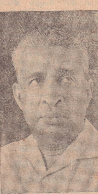
தேன், சமூகங்களிடே ஒற்றுமையும், சென்னயகுந்தியும், ஏற்பட்டால் மட்டுமே பொருளாதார உச்சத்திற்கும் அடையமுடியும். இதைமனதில் கொண்டு நான் செயலாற்றுகிறேன்.

கொழும்பு, வெள்ளி "எனது கட்சி மட்டுமே அரசாங்கத்தை நிறுவக் கூடியதாக பெரும்பான்மை பலம் கிடைக்காது. தேசிய அரசாங்கத்தை அமைக்கும் சந்தர்ப்பம் கிடைத்தது எனது பெரும் பேறேயாகும். இதற்காக நான் நாட்டு மக்களுக்கு உதவியாக யவனுவேன்" என்று பிரதமர் திரு. டட்லி சேனநாயக்கா விவாதத்தை அரசாங்க தரப்பில் முடித்து வைத்துப் பேசுவதில் குறிப்பிட்டார். பிரதமர் திரு. டட்லி சேனநாயக்கா மேலும் குறிப்பிட்ட தாவது:-