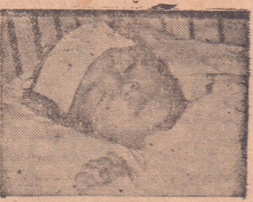
சுகவீனத்தின்போது புத்துணர்ச்சி லக்ஷ வல்லது

பஜனை தொல்புரம், வெள்ளி தொல்புரம் ஆதிமுத்துமாரி அம்பாள் லயத்தில், தொல்புரம் மத்திய சனசமூக சிபை வாகிசகாலையின் கைமாறக் கடைசி வெள்ளிக்கிழமை நடத்திய பஜனையில் அதிகமானவர் பங்குபற்றினர்.