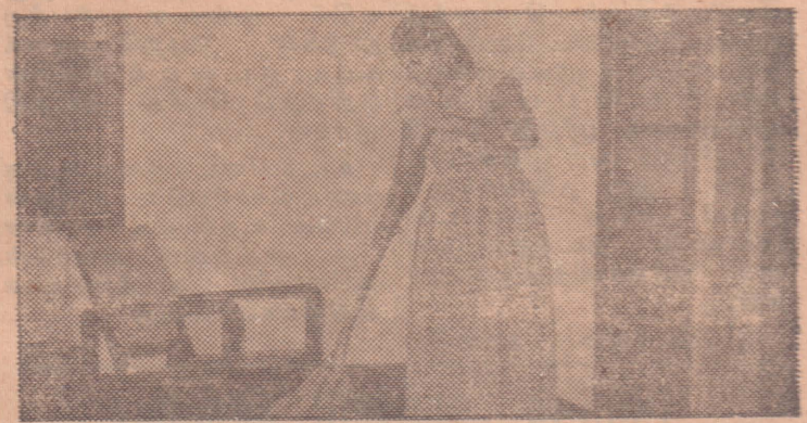
விட்டைக் கூட்டி, ஒழுங்குபடுத்தி