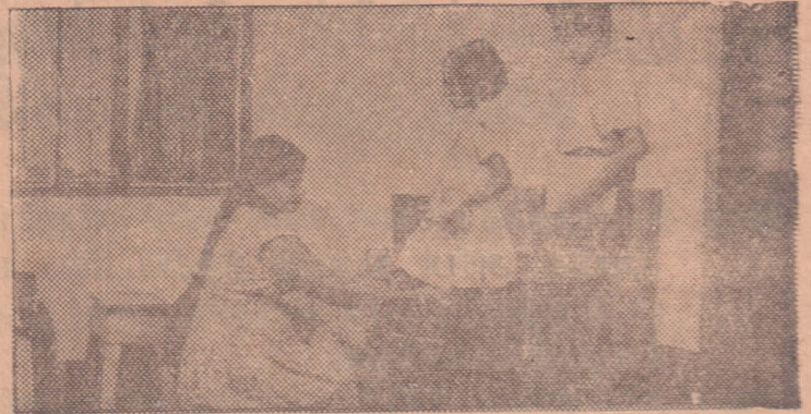
பட்டிட்டுப் பொட்டிட்டுச் சிறுவர்களை பாடசாலைக்குனுப்பீ