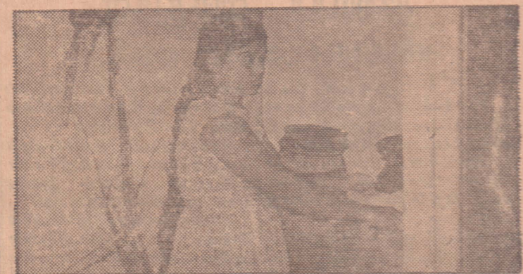
மட்டற்ற சமையல் வேலைகளை நாள்தோறும் செய்து களைத்திருப்பதால்