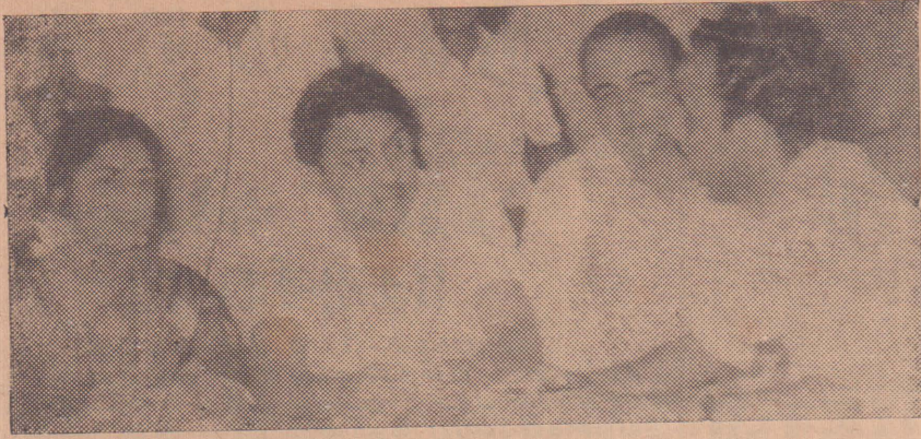
இலட்சிய நடிகர் திரு. எஸ். ராஜேந்திரனும் அவரது மனைவி நடிகை விஜயகுமாரியும் அண்மையில் யாழ்ப்பாணத்துக்கு விஜயஞ் செய்தபொழுது "சுழநாடு" நிருபருக்கு அளித்த பேட்டியின்போது எடுக்கப்பட்ட படம்.