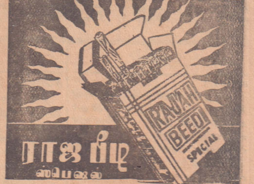
ராஜ பீடி கம்பெனி கொழும்பு 14

சென்னை National Tamil Daily மார்ச் 1966 (1-6-66) இதழ் 114