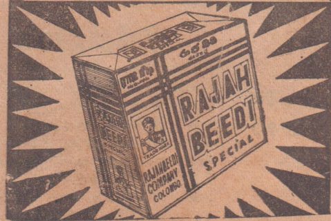
ராஜ பீடி கம்பெனி, கொழும்பு-14.