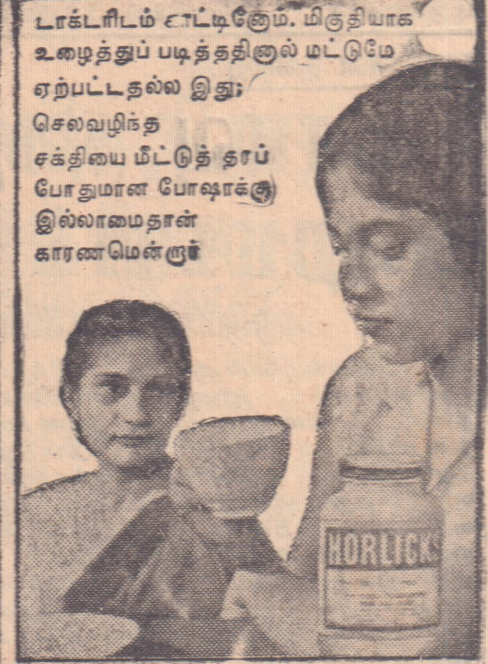
லாட்டரிடம் ஈட்டிக்ளும், மிகுதியாக உழைத்துப் படித்ததினால் மட்டுமே ஏற்பட்டதல்ல இது; செலவழிந்த சக்தியை மீட்டுத் தரப் போதுமான போஷாக்கு இல்லாமல்தான் காரணமென்றால்

நன்கு உழைத்துத் தான் படித்து வந்தாள் அவள். ஆனாலும் பரீட்சைக்குச் சில நாட்களே இருக்கையில், ஏதோ அவளுக்குப் படிக்க முடியாமல் சோர்வு மேலிட்டது