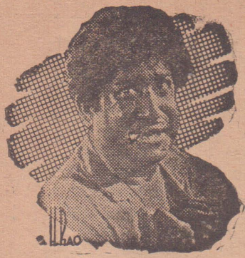
சிவாஜி நடத்த 100 படங்கள்

பத்மஸ்ரீ பட்டம் பெற்றுள்ள நடிகர் திலகம் சிவாஜி கணேசன் இதுவரை நடத்தியுள்ள 100 படங்கள் வருமாறு: