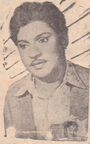
(சென்னையில் நடந்த ஒரு கூட்டத்தில் எஸ். எஸ். ஆர். இப்படியாகப் பேசியுள்ளார்.)

1967 தேர்தலுக்குப் பிறகு தி. மு. க. மந்திரி சபை அமைந்து விடும். அந்த மந்திரி சபையில் அண்ணா முதலமைச்சர், நாவலர் நெடுஞ்செழியன் கல்விமந்திரி, கருணாநிதி நிதிமந்திரி, நான்தான் கலைமந்திரி!