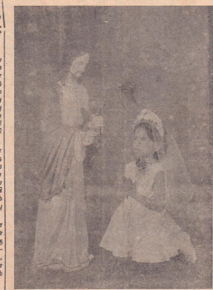
முதல் தேவ நற்கருணைபெற்ற இச்சிறுமி, எதிர்காலத்தில் தாம் சீரும் சிறப்புடனும் வாழ்ந்து பேரும் புகழும்பெற விரும்பி ஆண்டவரிடம் நற்கருணையுடன் நல்லாசி பெறும் சாயலில் இங்கு காட்சி தருகிறார்!

புடைவை என்னும் சொல்லை, புடைவை என்பவர் வழங்குகிறார்கள். இது பிடவை எனவும் சிலரால் வழங்கப்படுகிறது. புடைவையென்பதே திருத்தமான சொல்.