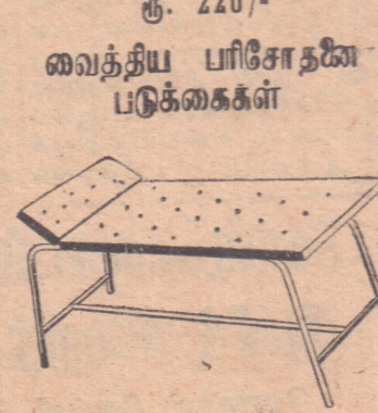
த. பர்மா டக் டிரேடிங் கம்பெனி லிமிட்டெட். 62, புளுமென்டால் ரோட், கொழும்பு-13. தொடர்பு கொள்ளுகள் தொலைபேசி: 2239. கிராம்ஸ்: Tea...