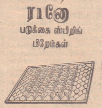
பல அளவுகளில் (in various sizes) டிஸ்ட் ஸ்பிரிங் கட்டிகள்

சந்திரன் செம்மையான உருண்டை வடிவிலே இருக்கவில்லை என்பதை அமெரிக்கா அனுப்பிய செவ்வழிப் பணர் ஆர்பிட்டர் என்ற விண்வெளி கப்பல் தெரிவித்துள்ளது. தகவல் இது