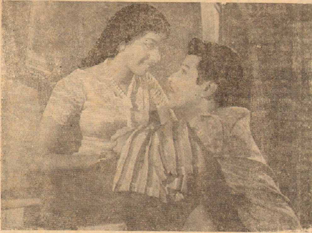
'விழிகள் சொல்வதெல்லாம் நிஜமா? உன் கண்ணை உண்மை சொல்லும் சாட்சியா? பெண்ணை நீ வானவில்லின் வர்ணஜாலமா?' என்று கே. ஆர். விஜயாவிடம், ஜெய்சங்கர் கேட்கிறார் போலும்! 'சேலம் முவிஸாரின் 'தங்க வளையல்' திரைப்படத்தில் இடம் பெறும் காட்சி இது!

'பி' விஜயாவிடம் ஜெயசங்கரின் வீட்டுக்குப் போகச் செய்தாக, அவர் சகோதரர்தான் பதில் கொடுப்பார். 'ஜெய்'க்கு இப்போது 'ரேமே' இடையே ஒரே சூட்டில்! இரவு பத்து மணிக்கு மேலாகத்தான் வீட்டில் இருப்பார். அப்போது போனில் பேசலாமே!'' என்கிறார் அவர் சகோதரர்.