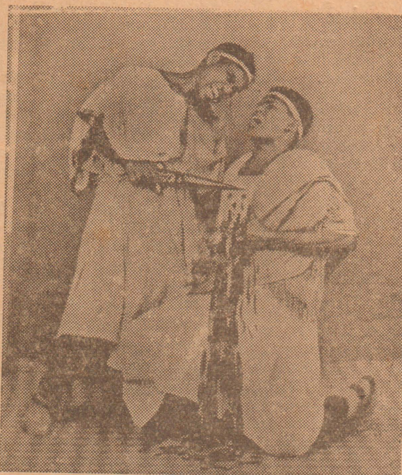
"ஆ! புருட்டஸ் நீயுமா!"

ஷேக்ஸ்பியரின் 'ஜூலியஸ் சீசர்' என்ற சோக நாடகத்தை கடந்த 19-ம் திகதி இரவு குருநகர் நாடக மன்றத்தினர் நடித்துக் காட்டினார்கள். மிகவுமேபற்றத்தக்கதோர் முயற்சியின்றே கூறவேண்டும். கொலையுண்ட சீஸரின் பிரேதத்தைப் புதைக்கவந்த அந்தனி தனது சொற்சாதுரியம் மிக்க பிரசங்கத்தினால் ரோமாபுரி மக்