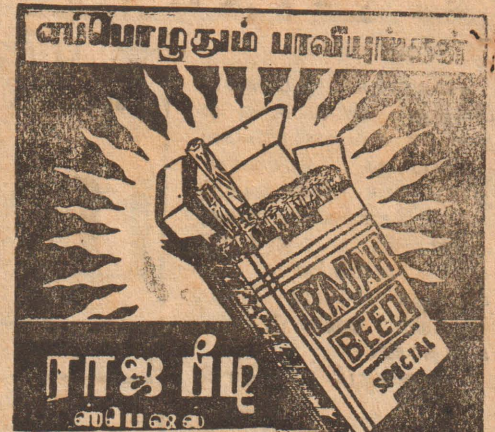
ராஜ பீடி கம்பெனி, கொழும்பு-14

தேசிய தினசரி National Tamil Daily நலர் 9 [1-8-67] இதழ் 171 யாழ்ப்பாணம்பிலவங்க ஆடி.16 ரபிஆகி2 செவ் ாக்கிழமை