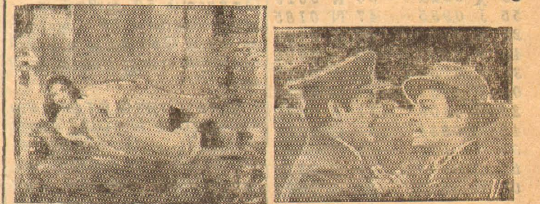
ஏவி. எம். புரொடக்ஷன்ஸ்