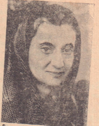
முனைவதாகவும், பலாத்காரம் எந்தவித பலனையும் தரா தென்றும் கூறினார்.

புதுடில்லி, நவ. 25 திருமதி இந்திரா காந்தியின் மந்திரிசபை மீது நேற்று லோக்சபையில் கொண்டுவரப்பட்ட நம்பிக்கையில்லாத் தீர்மானம் 88 வாக்குகளைச் சாதகமாகவும் 215 வாக்குகளைப் பாதகமாகவும் பெற்றுத் தோல்வியடைந்தது.