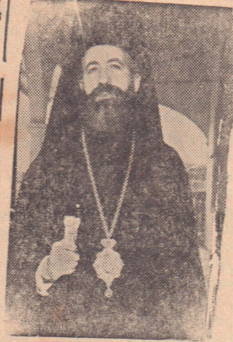
அதலாந்திக் ஒப்பந்த நாடுகள் பாதுகாப்பு ஸ்தாபனத்தைச் சேர்ந்த பிரதிநிதி ஒருவரும் வந்து சேர்ந்துள்ளனர். இவர்களும், கிரீசுக்கும் துருக்கிக்குமிடையே சமரசம் ஏற்படுத்த முயற்சிகள் மேற்கொள்வார்கள்.