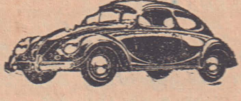
சட்டியுப்பு இல. 170

சட்டியுப்பு இல. 170; தேதி 30-11-67 புத்தம்புதிய வோக்ஸ் வகன் 1300 கார் ரூ. 12,500/-