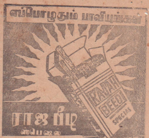
ராஜ பீடி கம்பெனி கொழும்பு-14