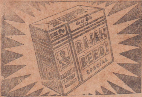
ராஜ பீடி கம்பெனி, கொழும்பு-14.