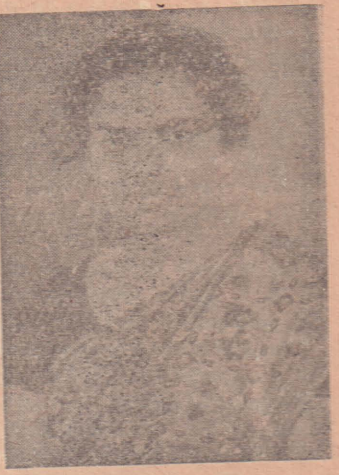
குழந்தையில் பலர் குடத்துக் கிளக்குப்போல இருக்கிறார்கள். சமுதாய நிலை காரணமாக அவர்களது அறிவு ஏனையோருக்குப் பயன்படாது அவர்களோடேயே மடிந்து விடுகிறது. தமிழ்த்தலைவர்கள் அறிஞர்கள் சிந்தித்தால் பல நன்மைகள் பெட்டி:-