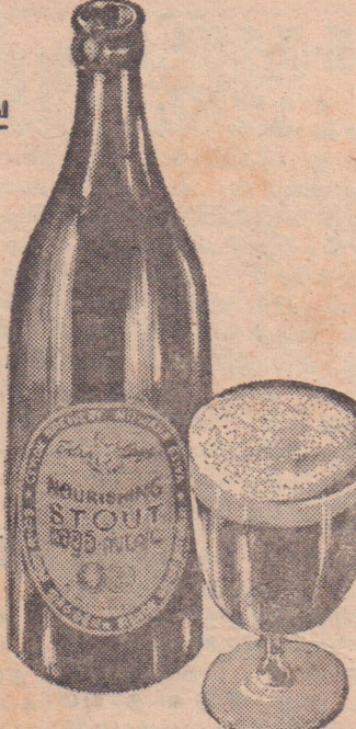
அது தருவது மதுரமானது மிருதுவானது விட்டமின் பி செறிந்தது கிலோன் புருவரி லிமிட்டெட், நுவரேலியா.

உத்தம சத்தாட்டும் இரு மடங்கு சக்தி வாய்ந்த நுவரேலியா ஸ்டவுட் அருந்துங்கள்